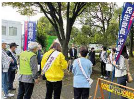
PR活動前の集合の様子