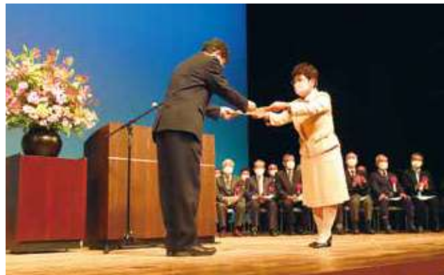
鶴見区長から委嘱状を受けとる区副会長

当日は、各連合町内会長などのご来賓が見守る中、民生委員・児童委員294名、主任児童委員33名、合計327名に厚生労働大臣、横浜市長からの委嘱状が、鶴見区長から伝達されました。任期は令和4年12月1日～令和7年11月30日までの3年間となります。