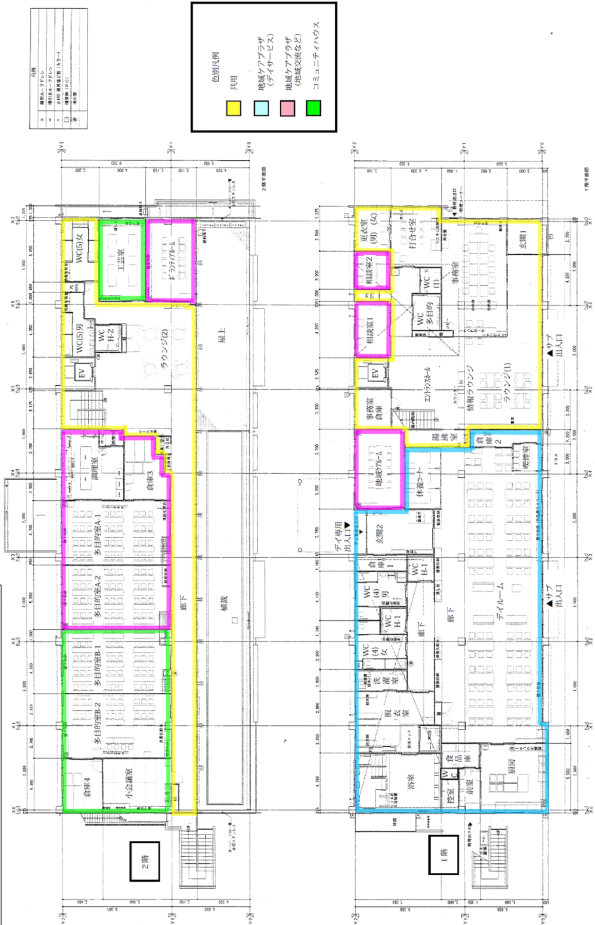
横浜市鶴見市場地域ケアプラザ・横浜市鶴見市場コミュニティハウス平面図