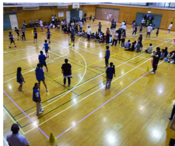
ドッジボール大会