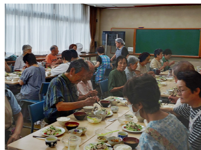
一人暮らし高齢者会食会「寿々め会」