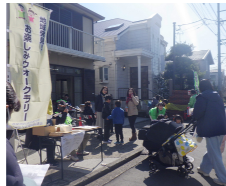
ウォークラリーイベント