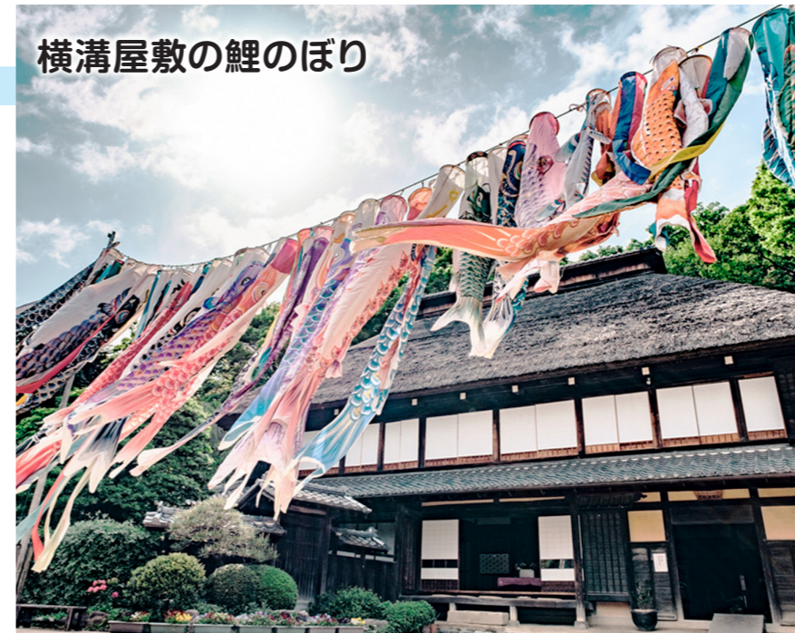
横溝屋敷の鯉のぼり

出典「横浜市統計ポータルサイト」、「住民基本台帳」（令和7年9月末日現在）※集計上の誤差があり、実態と一致しない場合があります。