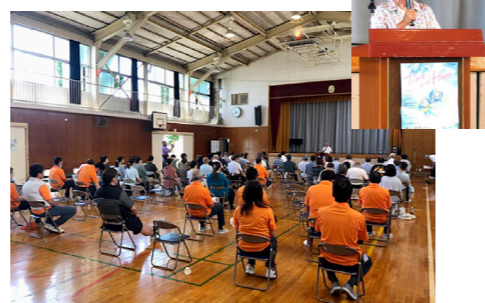
社会を明るくする運動