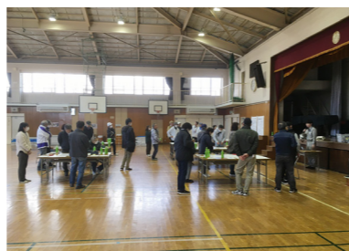
2024年12月 汐入小防災拠点訓練 HUG訓練を実施