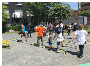
2024年8月 支え合い(愛)パーティー ラダートレーニング