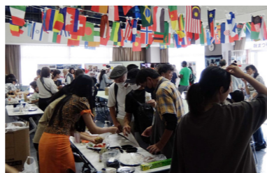
2023年9月 潮田交流プラザ秋まつり インターナショナルカフェ