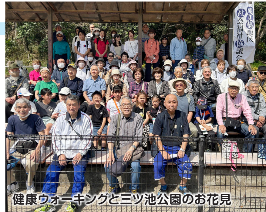
健康ウォーキングと三ツ池公園のお花見

出典「横浜市統計ポータルサイト」、「住民基本台帳」(令和7年9月末日現在) ※集計上の誤差があり、実態と一致しない場合があります。