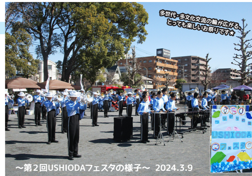
～第2回USHIODAフェスタの様子～ 2024.3.9

出典「横浜市統計ポータルサイト」、「住民基本台帳」(令和7年9月末日現在)※集計上の誤差があり、実際と一致しない場合があります。