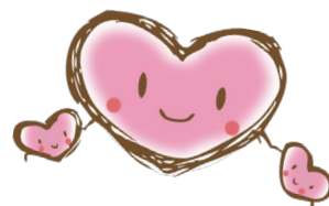
とつかハートプラン マスコット「こころん」