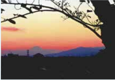
秋葉町 秋葉台公園