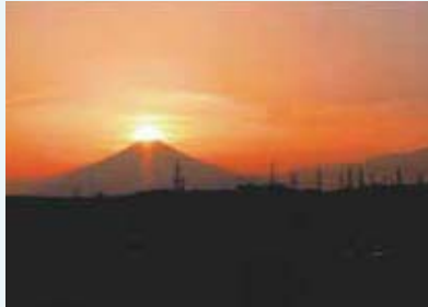
吉田町 大日谷公園