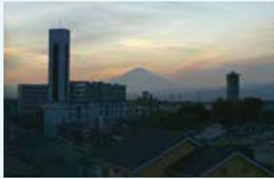
原宿三丁目 原宿八幡山公園沿いの道