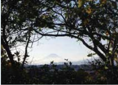
柏尾町(区境) 下永谷市民の森