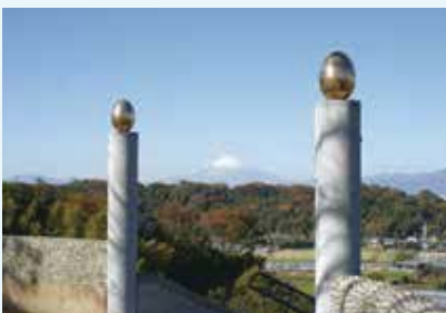
東俣野町 東俣野中央公園