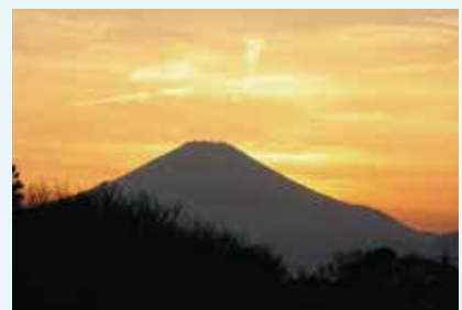
汲沢町 五霊神社周辺