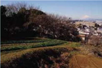
舞岡町 舞岡ふるさとの森(市民の森)