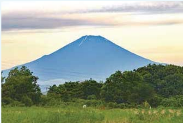
汲沢町 通信隊東側交差点