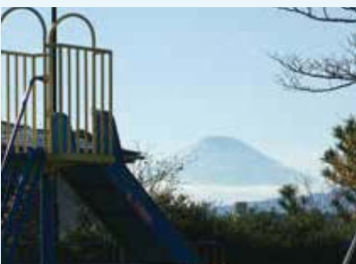
名瀬町 名瀬町第一公園