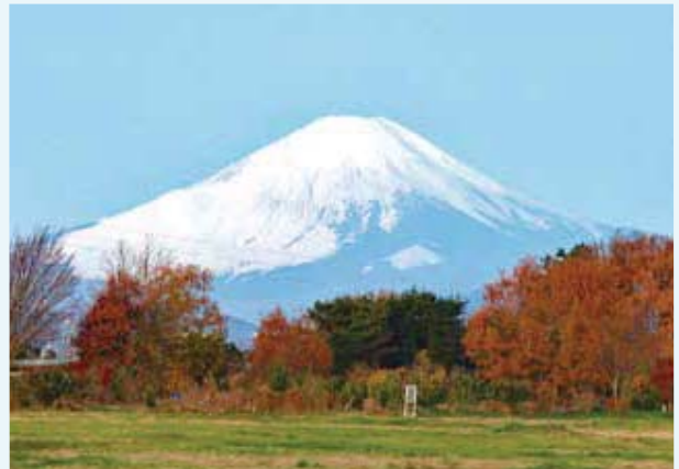
汲沢町 通信隊東側交差点