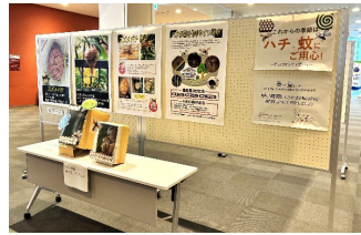
[ハチ早期駆除等啓発展]