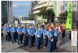
[秋の交通安全キャンペーン]