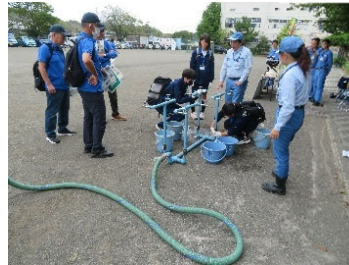
[中高生の応急給水訓練]