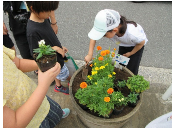
[小学校での花植え]