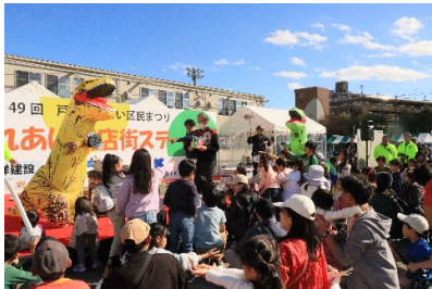
[戸塚ふれあい区民まつり]

人と人とのつながりを大切に、「第5期とつかハートプラン(戸塚区地域福祉保健計画)」を区民の皆様と共に推進し、子育て支援などの福祉保健分野をはじめ、地域の多岐にわたる活動を支援します。また、防災・防犯に全力で取り組み、誰もが安心して暮らせるまちづくりを進めます。