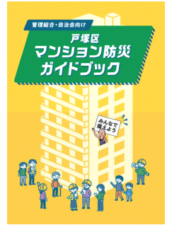
[管理組合・自治会向け マンション防災ガイドブック]