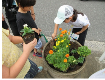
[小学校での花植え]