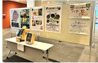
[ハチ早期駆除等啓発展]