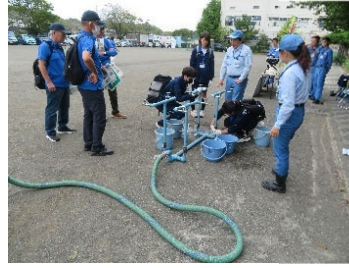
[中高生の応急給水訓練]