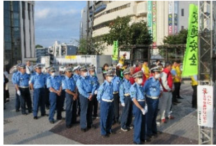
[秋の交通安全キャンペーン]