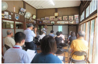
[スマホ相談室(谷矢部東町内会)]