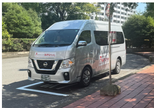
[秋葉町・名瀬町ワゴン型バス]