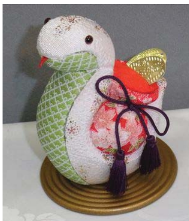
自主事業作品 木目込みの干支