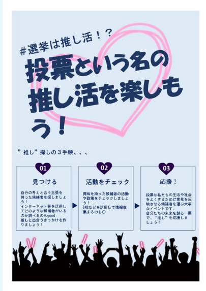
▶ 配布した啓発チラシ

令和7年5月24日（土）、明治学院大学の大学祭『第28回明治学院大学戸塚まつり』にて選挙啓発ブースを出展しました！シール投票による若者の選挙に対する意識調査と啓発物品の配布を行いました。当日は469人にご参加いただきました。