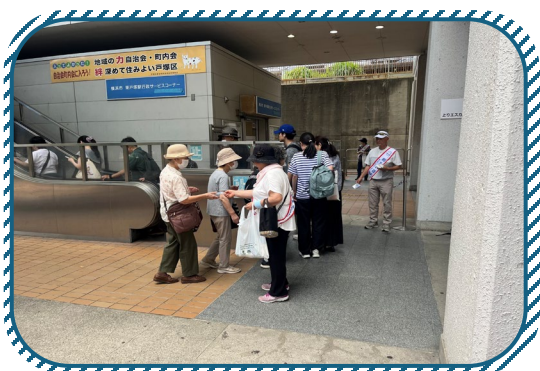
▶当日は2000個近い啓発ポケットティッシュを配布しました

7月13日（日）に東戸塚行政サービスコーナー前と戸塚駅地下東西通路にて街頭啓発を実施しました。 御協力ありがとうございました！