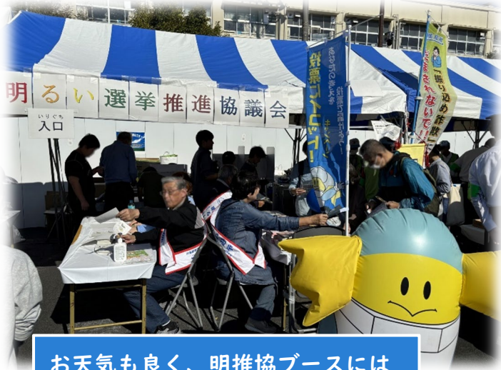
お天気も良く、明推協ブースには長蛇の列が…☀

令和6年11月3日（日・祝）に戸塚ふれあい区民まつりが開催されました。明推協ブースではキャラクター人気投票を実施し、啓発物品等を配布しました！当日は1,000人以上の方への啓発に成功しました◎