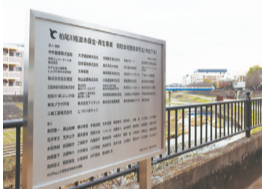
令和7年寄附者御芳名板

※市内在住の方は返礼品を受け取ることはできません。 ※市内在住の方も住民税等の控除を受けることは可能です。 ※在住場所に関わらず、1万円以上ご寄附いただいた方は区ホームページにお名前を掲載します。 10万円以上ご寄附いただいた方は柏尾川沿いに御芳名板を設置します。