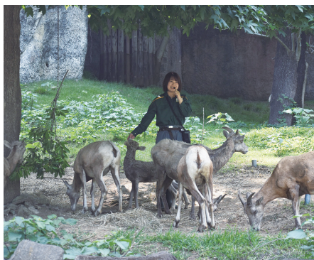
▲飼育員が担当動物について解説します

4月19日は「飼育の日」です。動物園の飼育員がどんな仕事をしているのか特別ガイドを実施します。こんな仕事もしているの!? という新たな発見があるかも! 日 4月19日(日) 詳しくはWEB