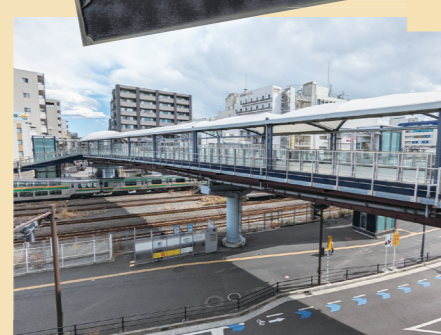
▶ 戸塚大踏切デッキ