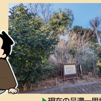
▶ 現在の品濃一里塚