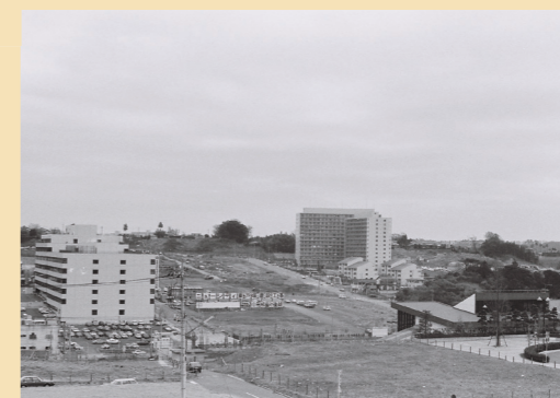
▶ 1985(昭和60)年の東戸塚駅周辺

東戸塚駅ができたのは今から46年前。地域に住む人たちの要望と民間の会社の支援によりつくられた、まさに「地域みんなでつくった駅」なんです！