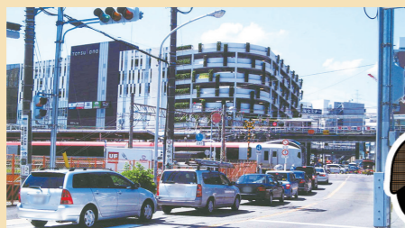
〈戸塚区制80周年記念誌より〉

2015(平成27)年まで使われていた、戸塚駅の北側にあった「戸塚大踏切」のことで。短いときは1時間のうち3分しか踏切が開かず、車の渋滞の原因となっていました。