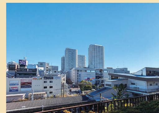
▶ 現在の東戸塚駅周辺