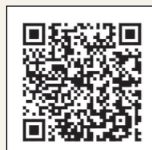
少年探偵 かつとくん