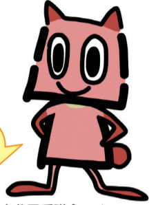
横浜市公園愛護会PRキャラクター「あいごぼん」

趣味:ガーデニング、外遊び ヒミツ:公園が好きなあまり、体の形が「公園」になってしまった