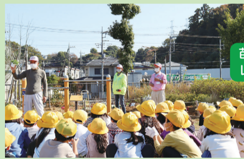
苗の植え方をレクチャー中!

主な活動! 月に1度の定例会のほか、普段は会員が好きな時間に来て花壇の手入れをしています。近隣には小学校や保育園があるので、花植えなど体験学習の際に協力したり、地域交流の一環として、定期的に公園内でイベントを開催することも。