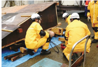
▲大地震で倒壊した家からの救助訓練