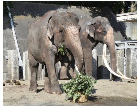
▲ゾウに門松(昨年の様子)

お正月にちなんだ装飾で皆さんをお迎えし、飼育員によるガイドもお正月バージョンで実施します。インドゾウへのお年玉は門松?! 動物園入口でくじを引いて、引いた動物のところで結果を見る「かなくじ」もお楽しみください 日 2026年1月2日(金)～4日(日)、かなくじは1月12日(月・祝)まで