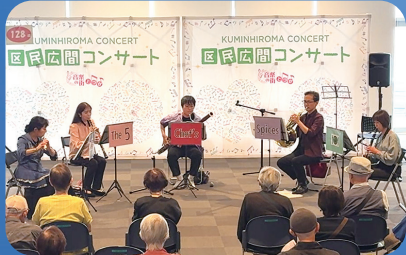
▲コンサート中の様子