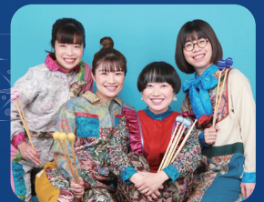
出演:どやどや楽団