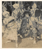
▲1938(昭和13)年のお札まき