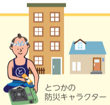
とつかの防災キャラクター

災害時、自宅で安全が確保できれば、住み慣れた自宅での避難生活がおすすめです。でも電気・ガス・水道などのライフラインは停止状態になる恐れがあります。よりストレスを少なくお家での避難生活を送るための備蓄品をいくつかご紹介します。