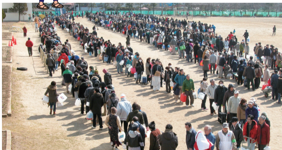
▲給水所で順番を待つ人々(仙台市)