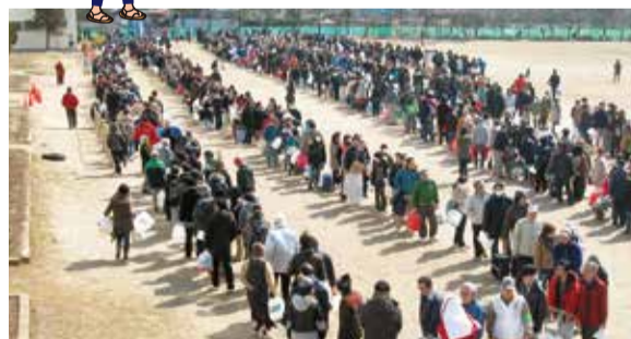
▲給水所で順番を待つ人々(仙台市)