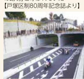
大踏切の混雑を解消するため、2015(平成27)年ついにアンダーパスが完成