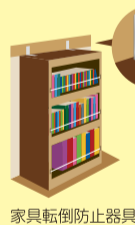
家具転倒防止器具