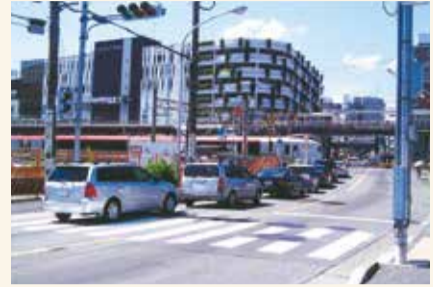
2015(平成27)年まで使用されていた戸塚大踏切は、ピーク時は1時間のうち57分遮断され「開かずの踏切」と呼ばれていた【戸塚区制80周年記念誌より】