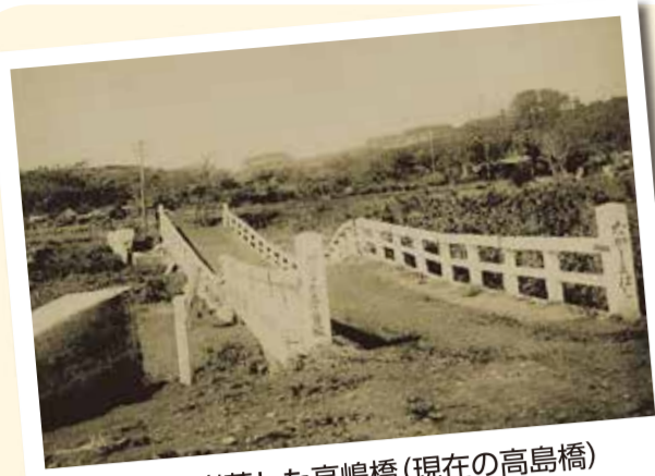
地震で崩落した高島橋(現在の高島橋)

写真:墜落セル鉄道戸塚大船橋高島橋「大正12年9月1日大震災写真帖」(横浜市中央図書館所蔵)