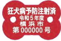
注射済票 ※年度ごとに色が異なります