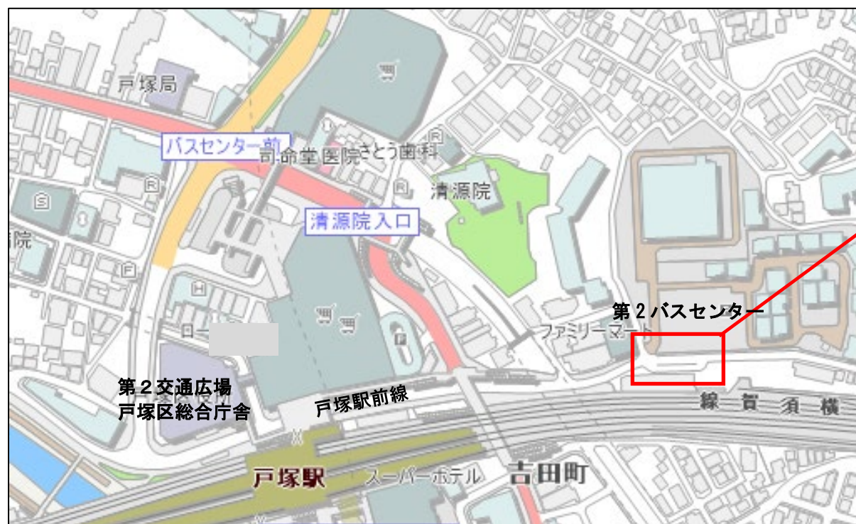
戸塚駅西口周辺の現況

令和2年2月に実施した戸塚駅前線での駐停車禁止等の社会実験の調査結果では、「駐車車両がなくなりスムーズに走行できた」「対向車のはみだしがなくなり接触の危険が減った」などの意見があり、マンション送迎バス乗降場整備、一般車乗降場利用促進及び一部区間の駐停車禁止の必要性が改めて確認されました。