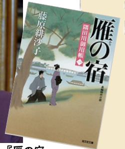
『雁の宿』 藤原緋沙子/著 光文社/刊行 (隅田川御用帳シリーズ1)