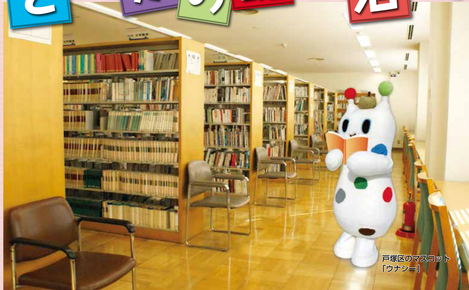
戸塚区のマスコット「ウナシー」