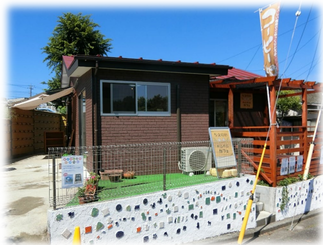
ぐるーぷ・ちえのわ