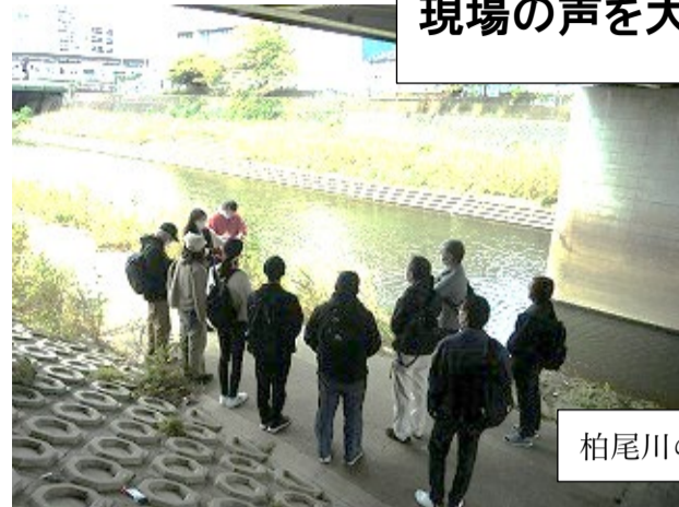
柏尾川の清掃活動