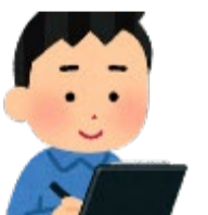
活動プランシート 例