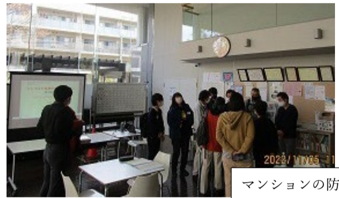
マンションの防災活動