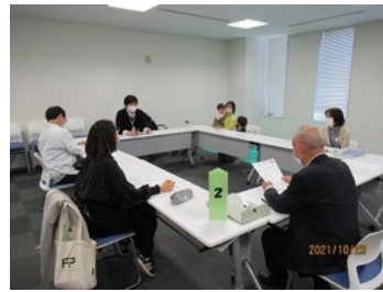
参加者同士の繋がりができました