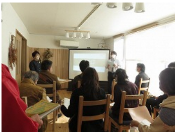
でこぼこの会の活動についてお話をいただきました