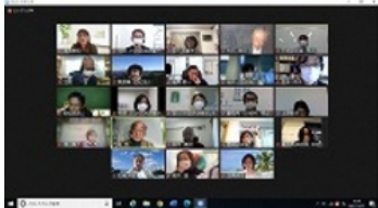
それぞれ思いのある活動プランの発表

いきなり活動を立ち上げるのは難しいので、「既存団体の活動との連携」等、活動プランを実現する際の貴重なアドバイスもいただきました。