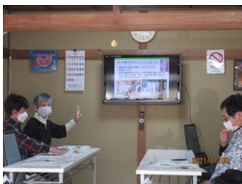
居場所立ち上げの経緯、苦労や楽しさ等をお話いただきました

「まず自分たちが活動を楽しむ」、「訪問者をお客様扱いせずに役割を持ってもらう」等、今後の地域活動にあたってのヒントをいただきました。