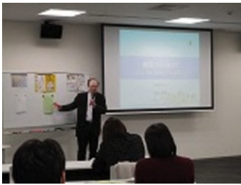
アドバイザーの地元、踊場地区連合町内会の取組もご紹介いただきました