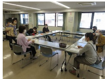
戸塚区社会福祉協議会に移動してグループワーク