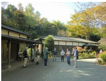
公園内施設、納屋を回り説明を聞く

NPO法人「舞岡・やとひと未来」の方々から、自然豊かで広大な公園での活動をご紹介いただきました。公園をご自身の居場所として生き生きと活動し、地域貢献につなげる実感を得られました。