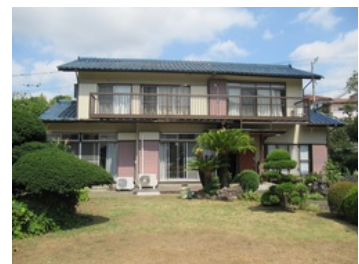
空き家を活用した「にこにこハウス」