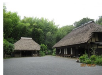
小谷戸の里には明治期の古民家が移築復元されています