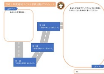
活動プランシートを作成していただきました