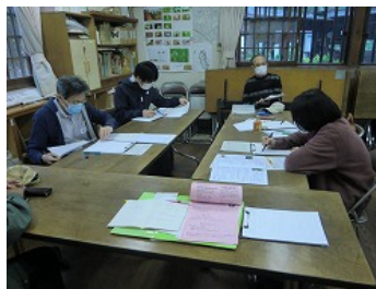
事務所でボランティアの原点を熱心に伺う