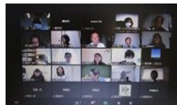
第1講はオンライン開催