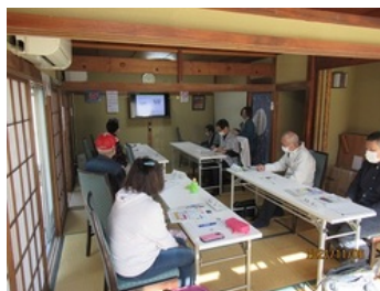
活動がどのように広がっていったか等、様々な質問ができました