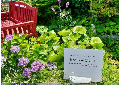
赤いベンチが目印の入り口