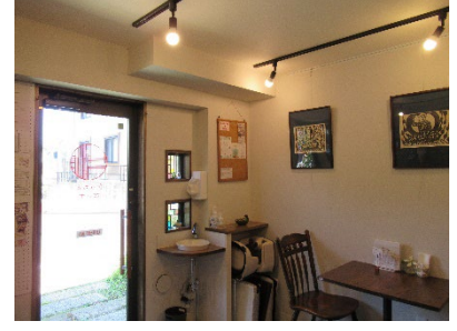
清潔感のある内装