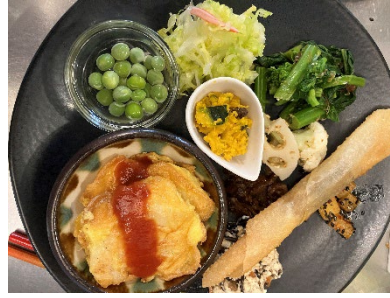
地場産野菜たっぷりの 「お惣菜プレート」