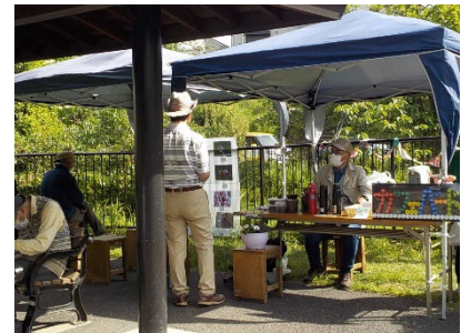
カフェバード、開店中！