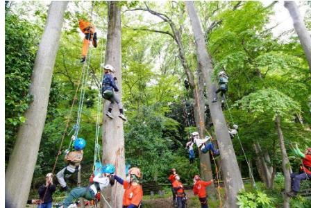
ツリークライミング体験