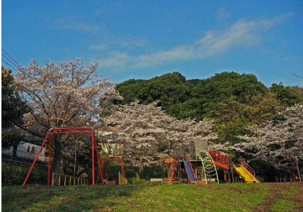
谷矢部池公園内の桜