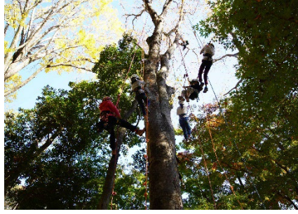
ツリークライミング体験