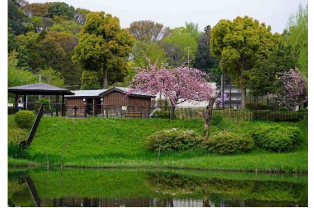
谷矢部池から臨む公園内の桜