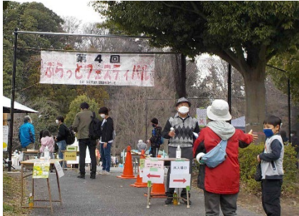
ぷらっとフェスティバル (3月)