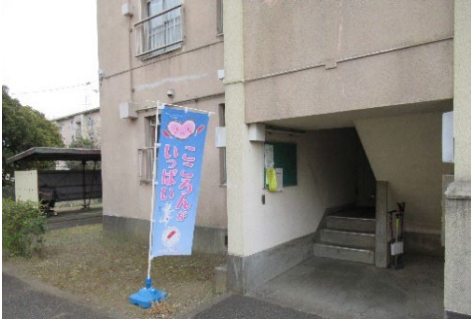
入口 階段を上がって正面 活動日は、のぼり旗が出ています！