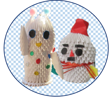
ブロック折り紙 メンバーの手作り

運 営 : 川上第一団地健康団地推進協議会 所在地 : 戸塚区川上町497 8号棟101号室 連絡先 : 045-821-6533 活動日 : 毎週木曜日 おしゃべりのつどい 毎月第2金曜日 「お花教室」開催中！ 毎月第4月曜日 「憩いのカフェ」