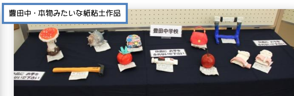
豊田中・本物みたいな紙粘土作品