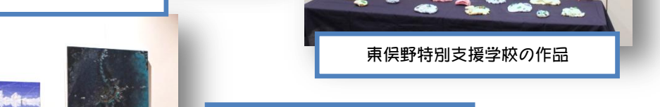
横浜桜陽高校・絵画