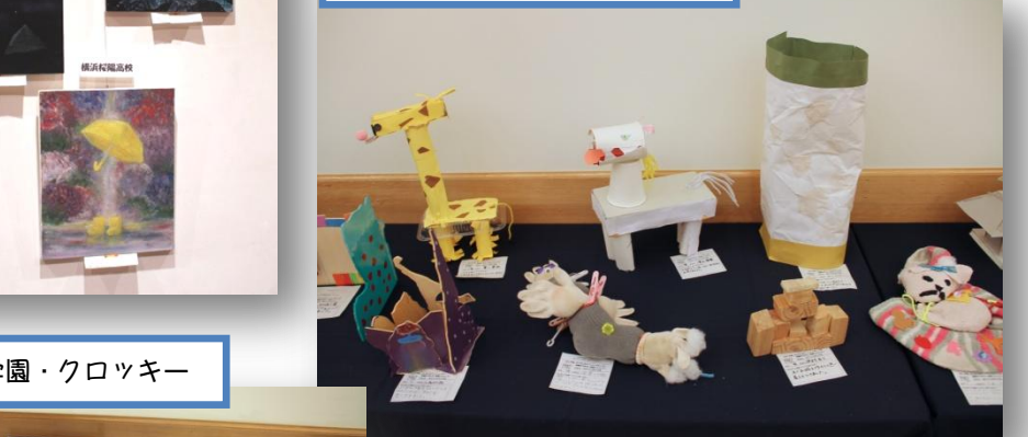
東俣野特別支援学校の作品