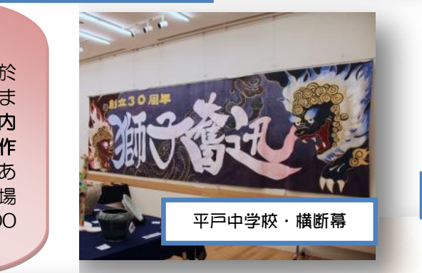
平戸中学校・横断幕