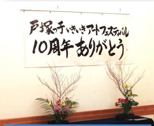
戸塚高校書道・南戸塚中、名瀬中生け花

1月14～15日に戸塚区役所3階多目的スペースに於いて、区内 38 校からの出展による作品展を開催しました。500 点を超えるやきもの体験教室の作品・区内中高生によるポスター・小中高特別支援学校の自由作品がならび、小学生のかわいい作品、中学生の感性あふれる作品、高校生の巧みな作品、そして今回 初めて参加してくれた明治学院大学の作品も!色とりどりの作品は感動ともに、ほっこりもさせてくれました(´o`)