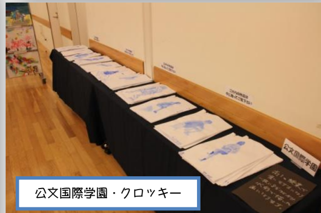
公文国際学園・クロッキー

10 周年の戸塚っ子いきいきアートフェスティバルはいかがでしたでしょうか？戸塚区の小学校、中学校、高等学校、特別支援学校全 45 校の 1 8 0 0 人以上の子どもたちが参加してくれました。素敵な発表、作品が多数発表されて元気をたくさんもらうことができました。戸塚っ子いきいきアートフェスティバルは 1 5 年 2 0 年と、これからも子どもたちと共に歩んでいきます。今まで以上に、子どもの元気を発表できる場として、そして戸塚の子どもと大人の笑顔がいつまでも続くように、実行委員はまた新しい内容を企画していきます。完成した愛唱歌をみんなで合唱しながら、子どもたちも今まで以上にすてきな姿を見せてくれると思います。次のアートフェスを楽しみにしててください。