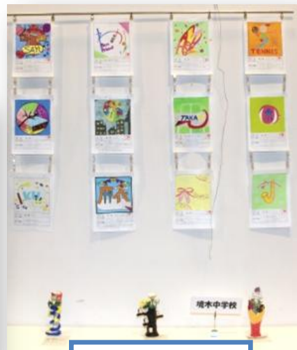
境木中学校の作品