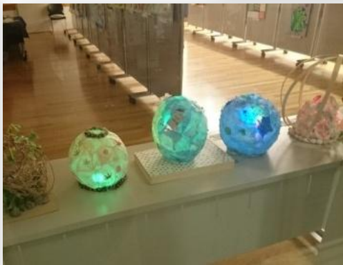
豊田中・ランプシェード