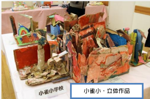
小雀小・立体作品