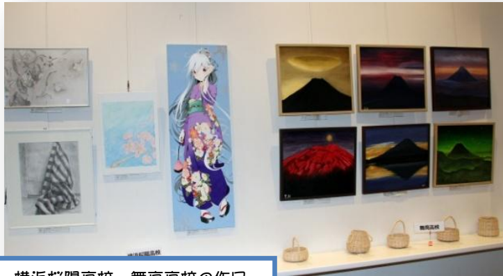
横浜桜陽高校・舞高校の作品