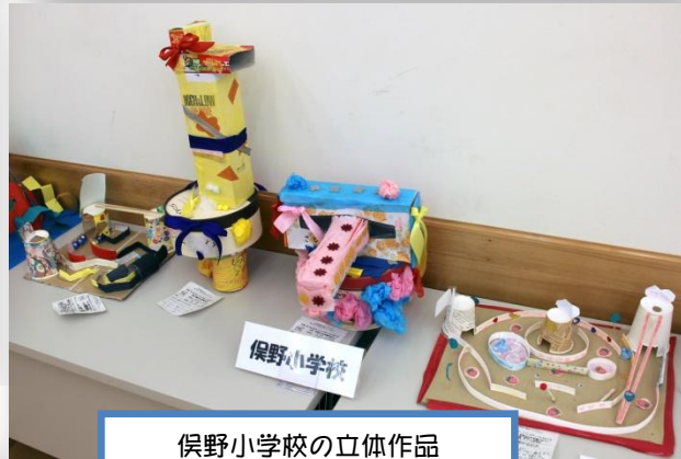
俣野小学校の立体作品

ポスター ：上矢部高校、戸塚高校、舞岡高校、横浜桜陽高校、秋葉中学校、汲沢中学校、境木中学校、大正中学校、戸塚中学校、豊田中学校、名瀬中学校、平戸中学校、深谷中学校、舞岡中学校、南戸塚中学校 焼き物体験 ：秋葉中学校、深谷中学校、倉田小学校、品濃小学校、名瀬小学校、矢部小学校 個別作品 ：明治学院大学、上矢部高校、戸塚高校、舞岡高校、横浜桜陽高校、公文国際学園、秋葉中学校、境木中学校、豊田中学校、名瀬中学校、平戸中学校、舞岡中学校、南戸塚中学校、東俣野特別支援学校、秋葉小学校、上矢部小学校、川上北小学校、汲沢小学校、小雀小学校、境木小学校、大正小学校、鳥が丘小学校、戸塚小学校、名瀬小学校、東品濃小学校、東戸塚小学校、舞岡小学校、俣野小学校、南舞岡小学校、深谷小学校、深谷台小学校、平戸台小学校