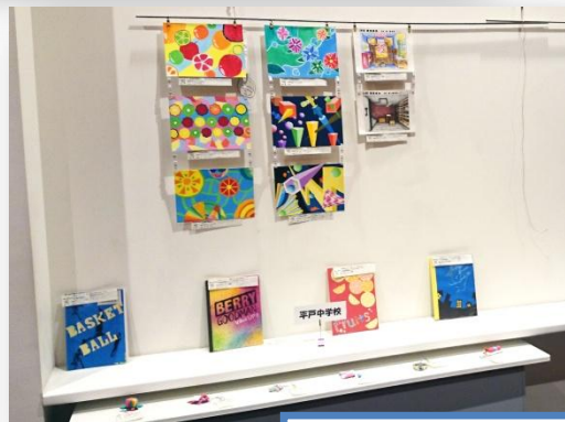
平戸中学校の作品