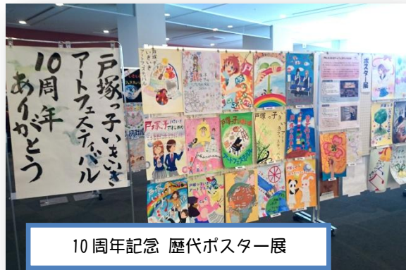
10周年記念 歴代ポスター展