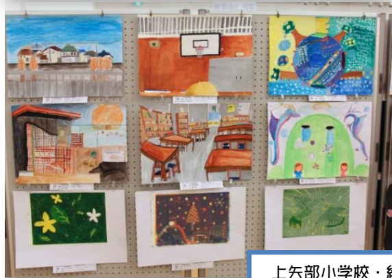
上矢部小学校・絵画