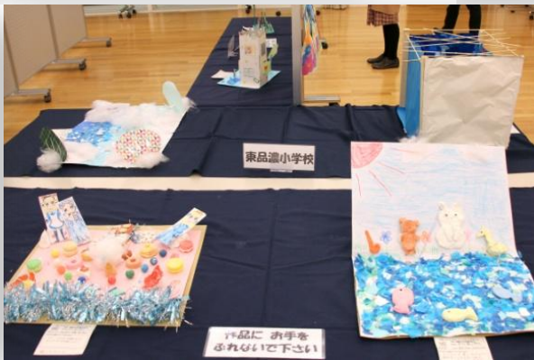
東品濃小学校・立体作品