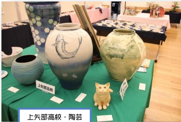
上矢部高校・陶芸

1月14～15日に戸塚区役所3階多目的スペースに於いて、区内 38 校からの出展による作品展を開催しました。500 点を超えるやきもの体験教室の作品・区内中高生によるポスター・小中高特別支援学校の自由作品がならび、小学生のかわいい作品、中学生の感性あふれる作品、高校生の巧みな作品、そして今回 初めて参加してくれた明治学院大学の作品も!色とりどりの作品は感動ともに、ほっこりもさせてくれました(´o`)