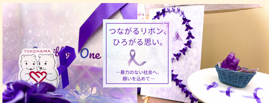
女性に対する暴力をなくす運動 関連参加型展示 (ぬい撮りブース・パープルリボンアート) (2025年11月)