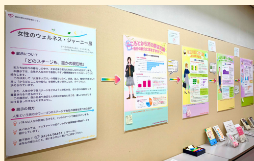
男女共同参画週間 関連パネル展示 女性のウェルネス・ジャーニー 展 (2025年6月)

男女共同参画週間(6月)や女性に対する暴力をなくす運動期間(11月)、国際女性デー(3月)についての啓発、その他各種テーマでの啓発イベントを実施しています。広報誌「フォーラム通信」の発行、ホームページ、メルマガ、SNSを通してジェンダー平等に関するニュースなどについても発信しています。