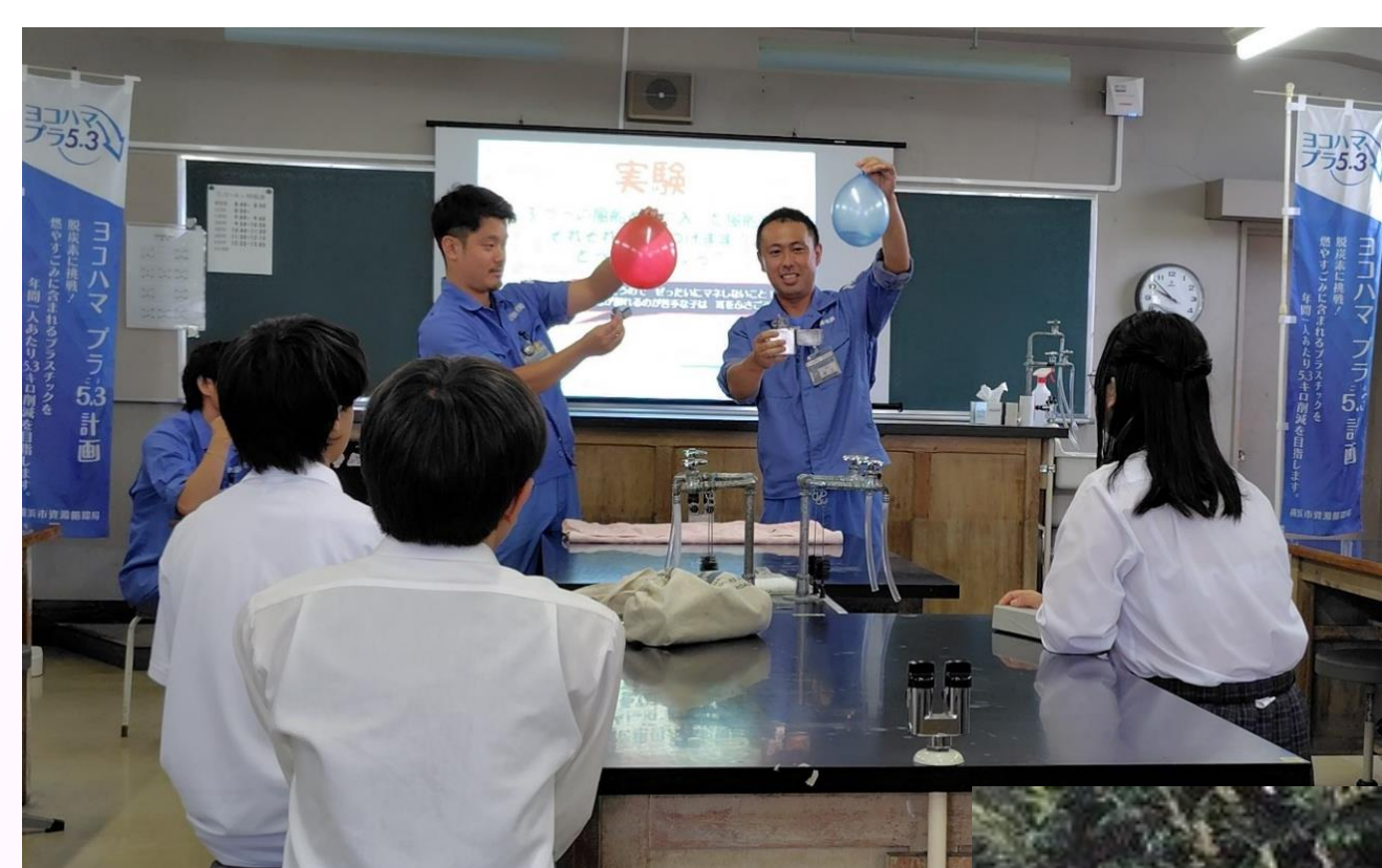
資源循環局職員 による講義 & ゴミの収集体験

ゴミって何だろう？ということに立ち返り、ゴミについて学び、 自転車置き場のペンキ塗りや藍染体験によって、アップサイクルを学びました。