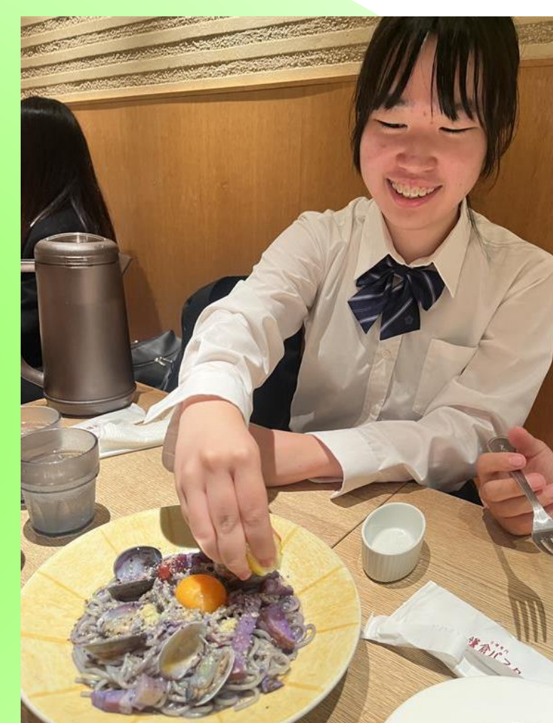
鎌倉パスタとコラボメニューの開発 「筍と桜姫鶏のすき焼き風パスタ」