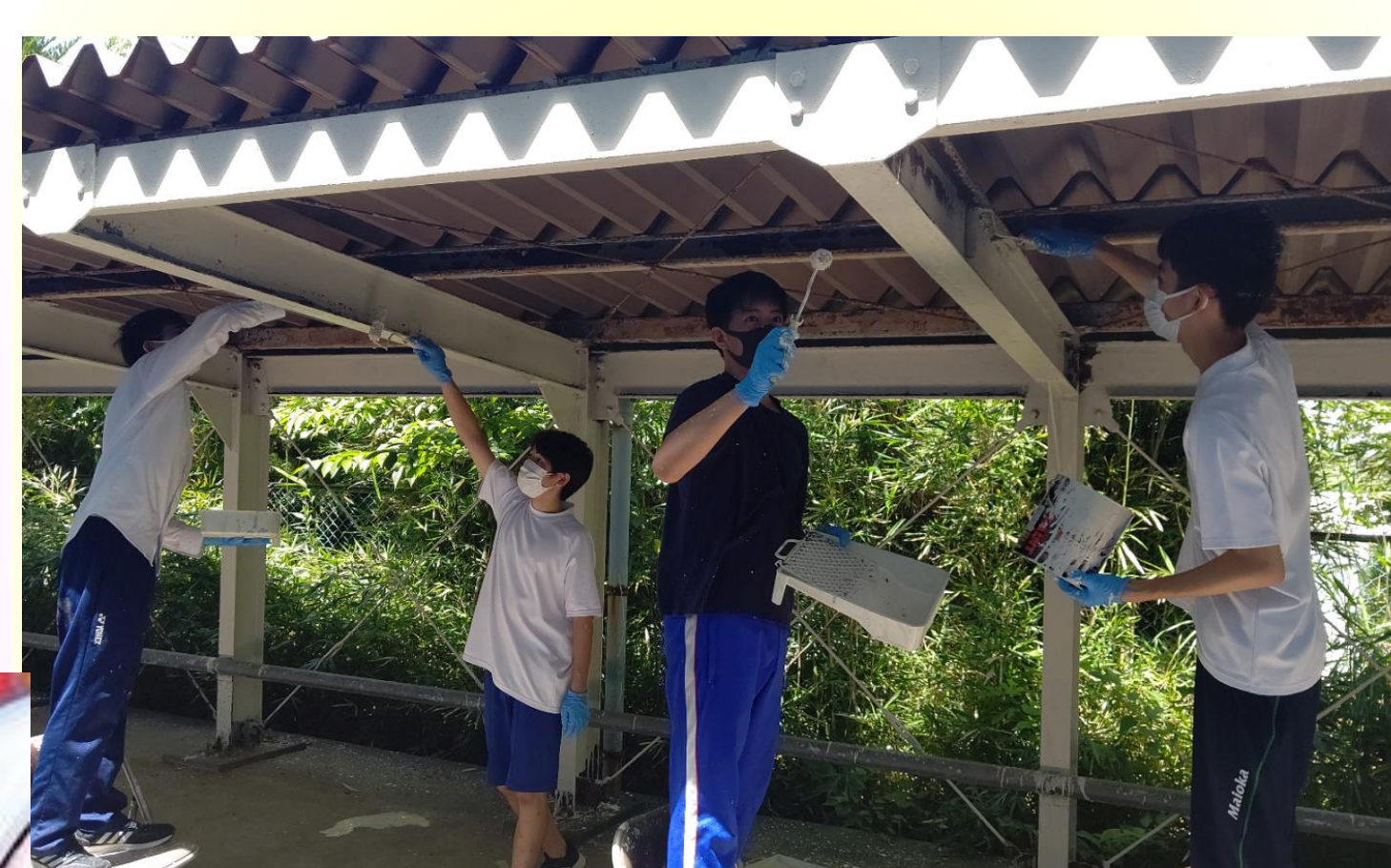
自転車置き場のペンキ塗り