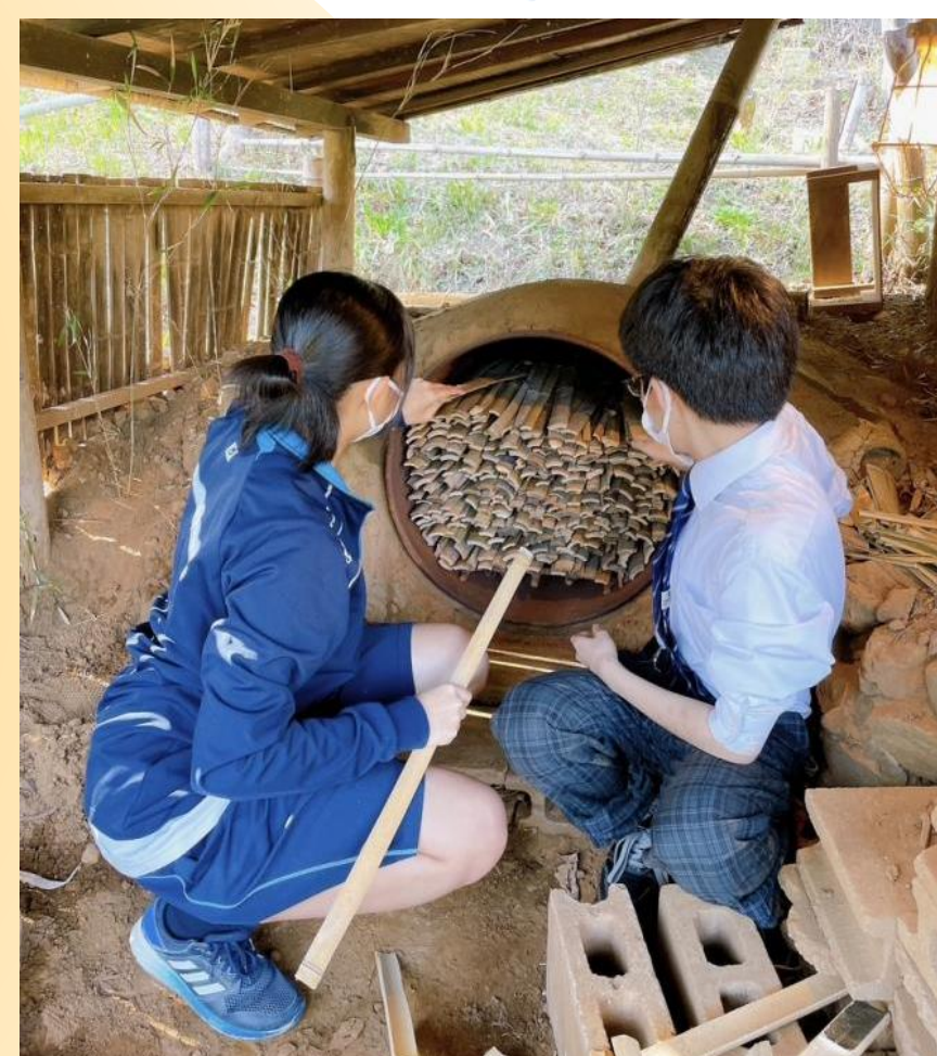
舞岡公園スタッフとともに門松作り&竹炭作り