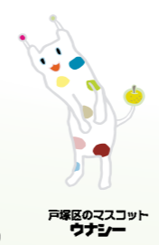
戸塚区のマスコット ウツノミヤ

323km離れた紀伊半島の先端からも見えるという富士山。わずか80km足らずの戸塚からは、きれいに富士山を望めるスポットがたくさんあります。そんな「富士見」スポットを紹介します。