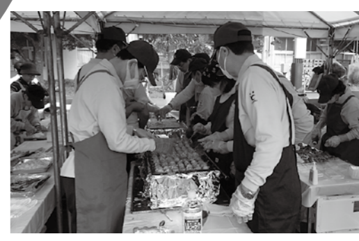
食べておいしいたこ焼き、チョコバナナ、 当たって嬉しい当てくじ

戸塚区青少年指導員も模擬店や青指ブース「工作体験コーナー」などで、戸塚ふれあい区民まつりに参加しています！ぜひ来てください！！ 焼きそば、タイ焼き、フランクフルト…。食べたら、何をしようかな？子どもからお年寄りまで世代を超えて楽しみましょう！