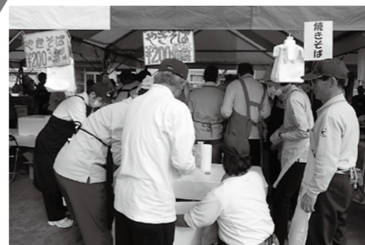
なつかしの味 “できたて・ほっかほか焼きそば”