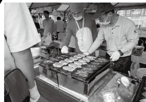
食べて納得！タイ焼きくん