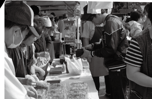
炭火で焼く名物倉田焼きそばと フランクフルトを召し上がれ！