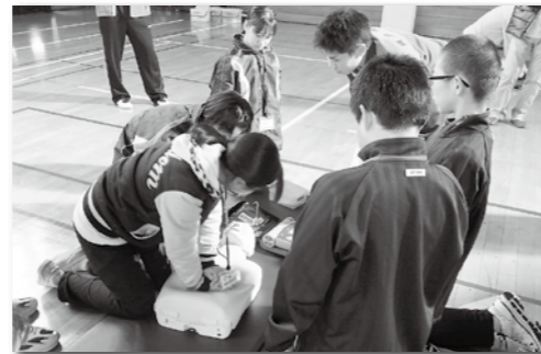
▲心肺蘇生法の講習