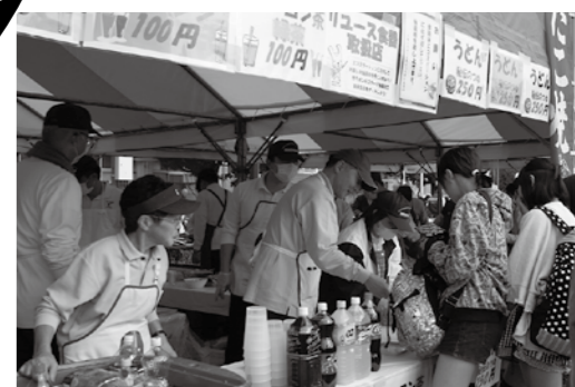
秘伝のだしの東戸塚うどん