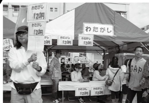
ふわ？フワ？フワ？不思議な食感!!