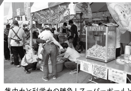
集中力と科学力の勝負！スーパーボールと 水ヨーヨー、疲れた脳にキャラメルポップコーン!