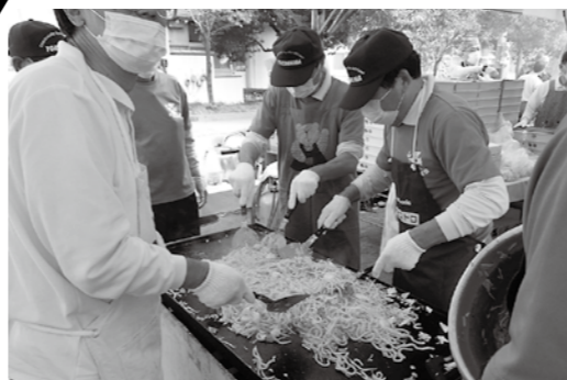
天かす♪かつぶし♪紅しょうが♪ 優しくお腹を満たす焼きうどん