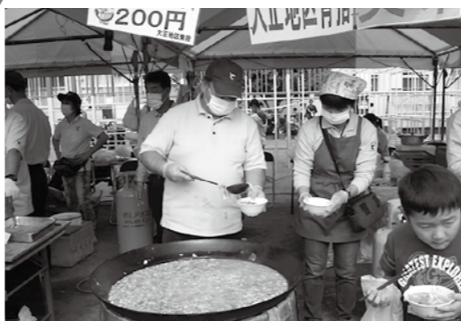
美味しさ抜群！大正の芋煮