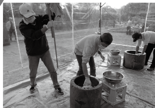
つきたて元祖かみやべ餅