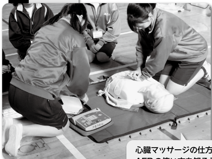
心臓マッサージの仕方、AEDの使い方を知ろう!!