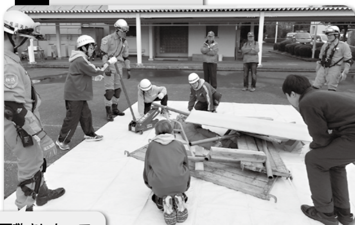
下敷きになって いる人を救出!!