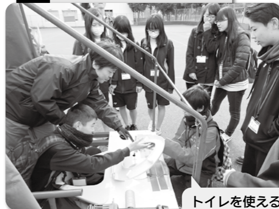
トイレを 使えるようにしよう!!