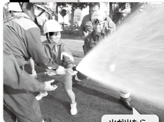
火が出たら すぐに消火!!