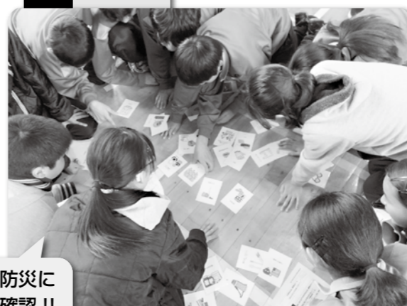
クイズ形式で防災に 関する知識を確認!!