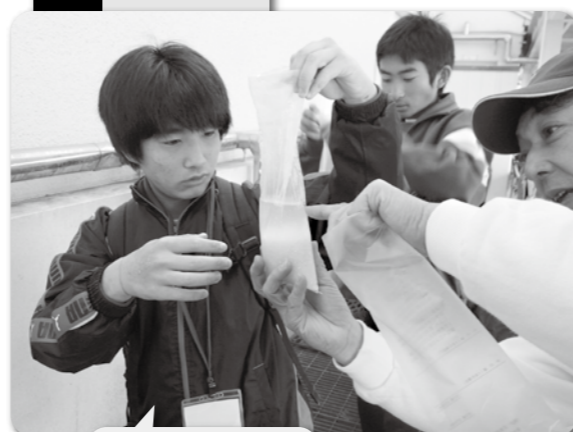
ビニール袋で お米を炊こう!!