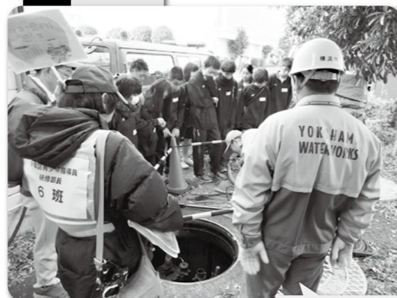
給水栓から 飲み水を確保!!