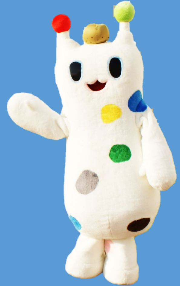
戸塚区のマスコット ウナシー