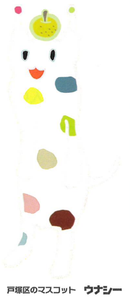
戸塚区のマスコット ウナシー