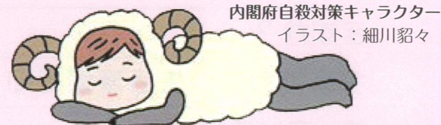
内閣府自殺対策キャラクター イラスト：細川韶々