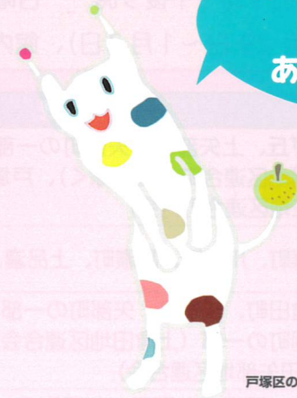
戸塚区の mascot ウナシー