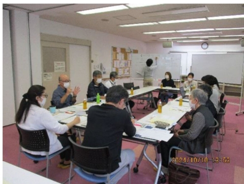
個別レベル地域ケア会議の様子

個別のケースについて、地域の支援者を含めた他職種多角的視点で検討を行うことで、個別課題への支援を行います。個別課題の積み重ねから、地域特性を分析し、その課題からより広い視点で地域課題を検討する機会として、包括レベルでの地域ケア会議を開催し、関係機関の役割分担及び相互連携を取った支援をします。