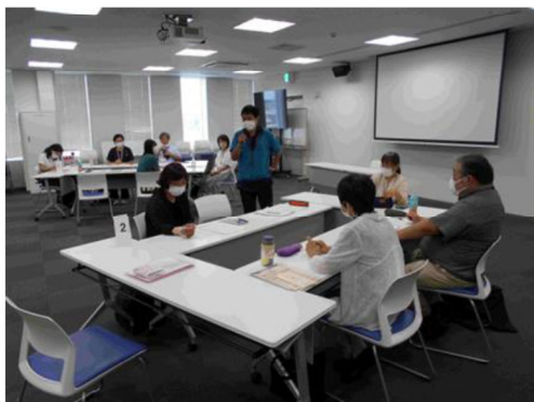
新任就労研修の様子

区内 11 カ所の地域包括支援センター（以下「区内 11 包括」という）の主任ケアマネジャー連絡会で共催し、区内居宅介護支援事業所の新任就労・予定研修、居宅主任ケアマネジャー研修を実施します。