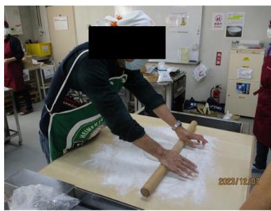
「初めてのそば打ちに挑戦」の様子