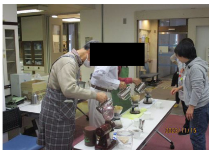
「違いが分かる大人のコーヒー」の様子

定年後の男性の地域デビューや家庭以外の居場所づくりのきっかけとするために、さまざまな内容で開催します。