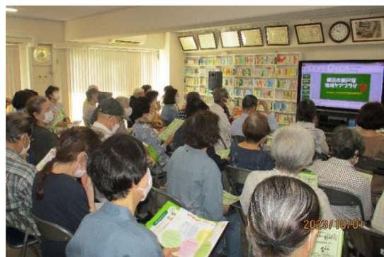
講座内でのケアプラザの周知の様子