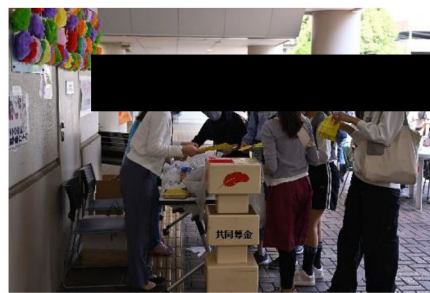
「東戸塚地域ケアプラザ祭り」の様子