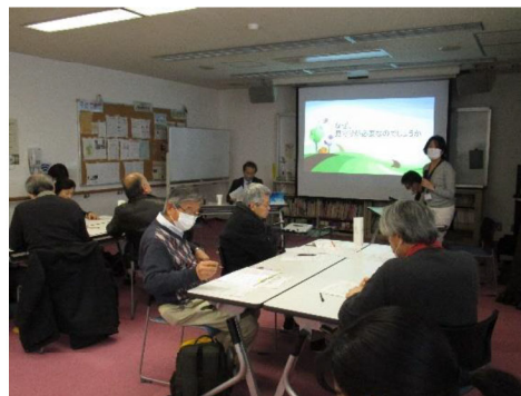
包括レベル地域ケア会議の様子