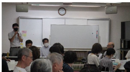
民児協での司法書士による成年後見講座の様子

成年後見制度などの制度的支援が必要な方については、関係機関と連携して対応します。適切な支援へつなげられるよう、意思決定支援のツールとして戸塚区版エンディングノート『ライフデザインノート』及び『もしも手帳』の周知を行います。また、地域に向けた「相続・遺言講座」「エンディングノート書き方講座」などを開催し、考えるきっかけを提供していきます。