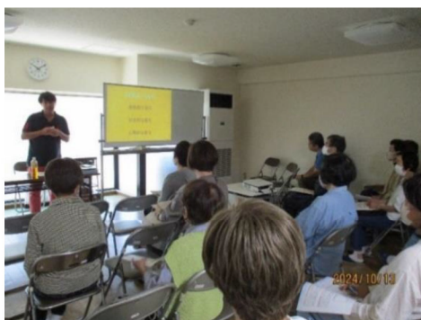
自治会向けの「認知症サポーター養成講座」の様子

高齢者が認知症になっても地域の中で孤立せず安心して暮らし続けられるよう、チームオレンジの取組を周知します。また、認知症の本人や家族の意思が尊重されるよう、日ごろから地域住民や関係機関、医療関係者とも顔の見える関係性を作り、切れ目ない支援体制を構築します。