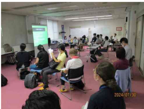
Kity メソッド事例検討会の様子

区内 11 包括の主任ケアマネジャーが分担して、区域で行われているケアマネジャー連絡会に参加し、関係づくりや情報共有を行います。また近隣の 3 地域ケアプラザ（東戸塚、名瀬、平戸）で 2 回シリーズの事例検討会を開催し、ケアマネジャーの支援と質の向上を目指します。