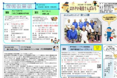
広報紙『はれやか通信さんぽみち』

また、地域包括支援センター、地域活動交流における相談や居宅介護支援、通所介護部門それぞれが地域の方に活用していただけるよう、情報提供にあたり様々な媒体（ホームページや広報紙）を使用して、必要な人に必要な情報を提供します。