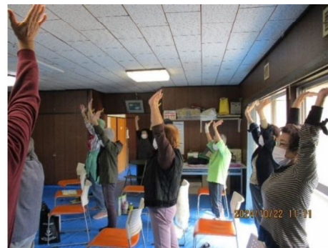
近隣団地の集会室での体操教室