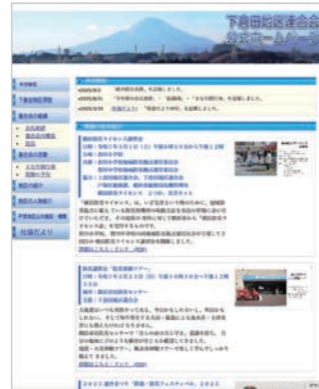
下倉田地区連合会ホームページ