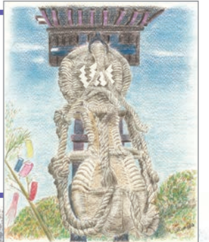
安全を祈願する「大わらじ」 (画：拱田 康司)

日頃のつながりや次の世代も意識した関わりを通じて、 安心・安全な街づくりを目指します