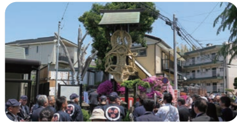
大わらじの掛け替えに集まる人々