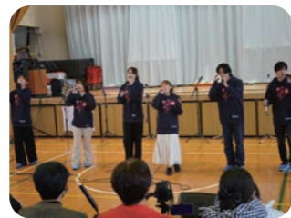
明治学院大学との連携