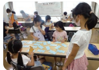
キッズサロン (世代間交流)