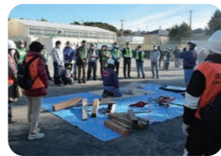
豊田中学校 地域防災拠点防災訓練