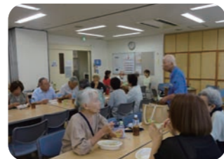
楽今日サロン (高齢者)