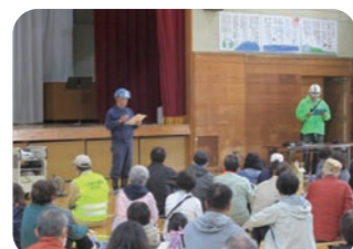
倉田小学校 地域防災拠点防災訓練