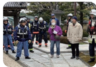
永勝寺 防火訓練 (県重要文化財)