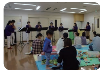
ハートぽっぽ (子育て)