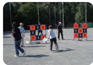
スポーツレクリエーション大会 (世代間交流)