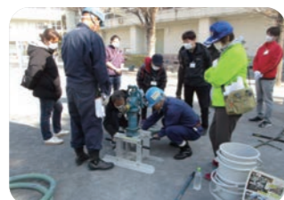
防災ライセンス講習会