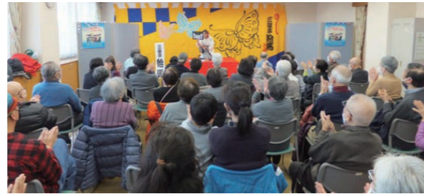
■ おなじみになった、戸塚第一寄席