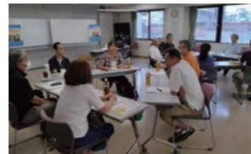
■ 新任自治会町内会役員研修会