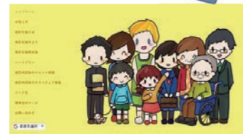
■ ホームページで情報発信