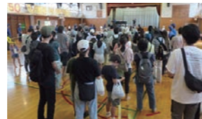
■ 多世代参加の健民ウォーク