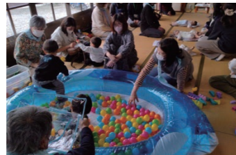
■ 令和7年には2つ目の子育て支援の新拠点開設