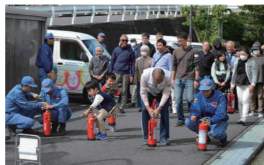
■ 各自治会町内会では防災訓練も