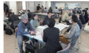
■ 団体交流会で情報交換