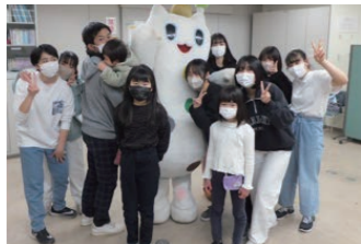
■ 多世代交流会にウナシーも参加