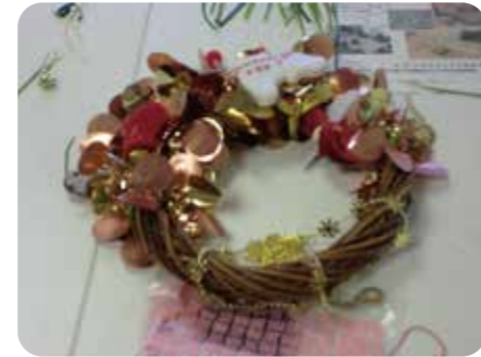
■ クリスマスリースづくり