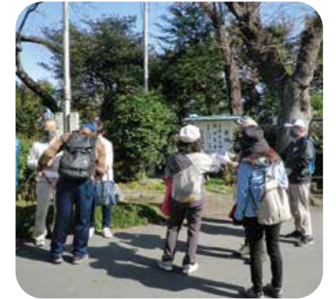
■ 汲沢ウォークラリー