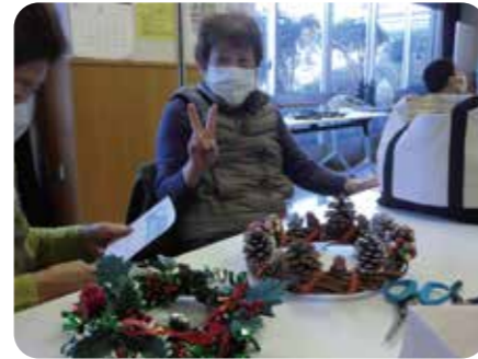
■ クリスマスリースづくり