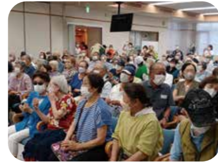
■ 75才以上の招待者の皆さん