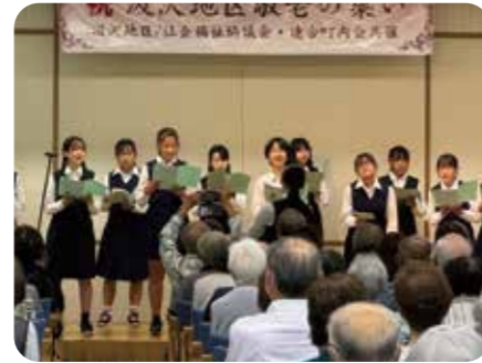
■ アトラクション(汲沢中学校合唱)