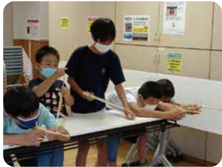
■ 割り箸鉄ぼうづくり

家や学校では作らない水鉄ぼうや割り箸鉄ぼうを製作する「夏休み工作教室」と高齢者にも人気のクリスマスリース作りの「冬休み工作教室」