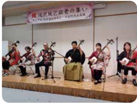
■ アトラクション(津軽三味線)

コロナ禍で開催できなかった「敬老の集い」は4年振りに再開しました。会場は空調設備が整った「子供の虹情報研修センター」で好評でした。