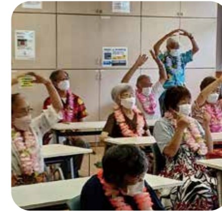
■ ぐみカフェ (フラダンス体験)